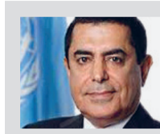
Discorso di apertura Nassir Abdulaziz Al-Nasser Alto Rappresentante delle Nazioni Unite per l'Alleanza delle Civiltà

Dignità e contributo della cultura araba nel dialogo con l'Occidente