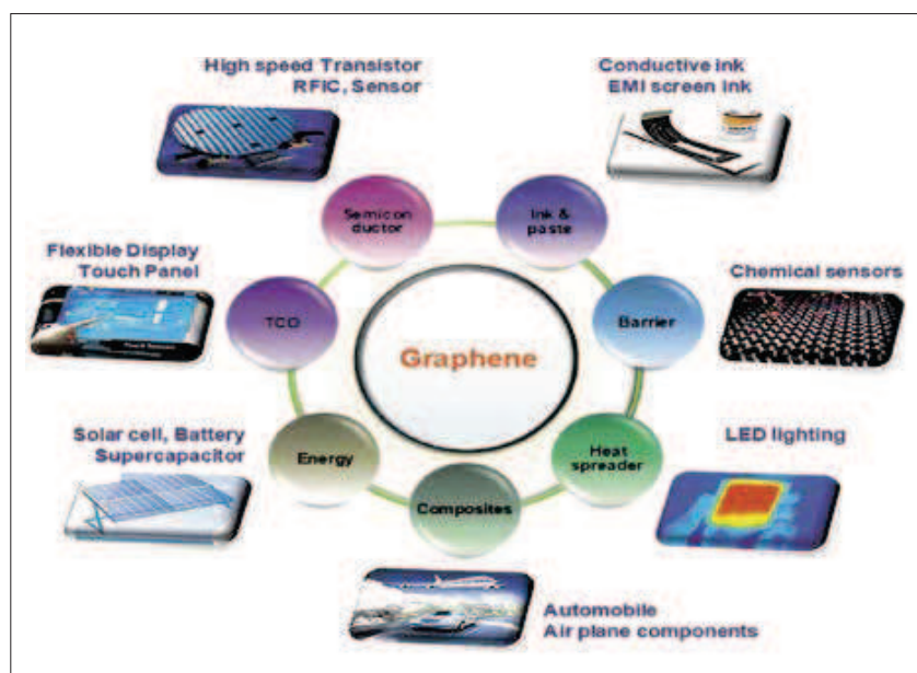
Le proprietà del grafene, dal paper a cui ha contribuito il prof. Pugno, pubblicato a fine febbraio sulla rivista inglese Nanoscale della Royal Society of Chemistry, "Science and technology roadmap for graphene, related two-dimensional crystals, and hybrid systems"

Insomma, l'avventura è solo agli inizi, e il Trentino farà la sua parte. ■